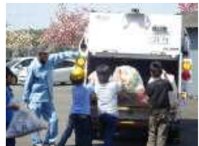
4/26 4年生パッカー車見学