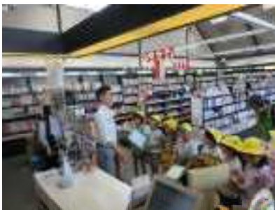
5/13 2年生お店たんけん