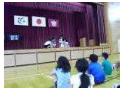
先生の劇「支え合いの木にやさしさの花を咲かそう」