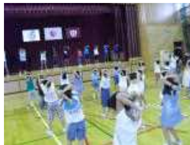
さわやかストレッチをみんなで