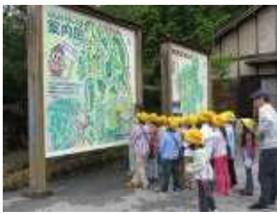
6/28 4年生[やまのこ学習](高取山)