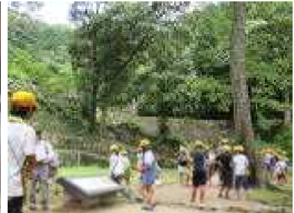
7/1 6年生 安土城跡・考古博物館

が …がまん強い体と心を育てよう も …物やお金は大事に生かして使おう う …受け持った仕事は、責任を持って最後まで続けよう の …のびのびと、外で元気に遊ぼう よ …余計な水や電気は使わないようにしましょう い …いつでもどこでも、元気にあいさつをしよう こ …交通安全にいつも気をつけよう