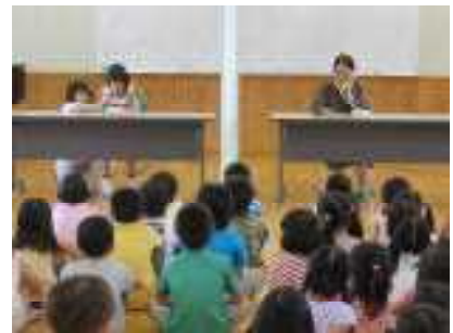
6/27 1・2年生 防犯教室