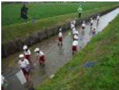
6/16 2年生 いきものたんけん

http://www2.higashiomi.ed.jp/gahigashisho/index.php