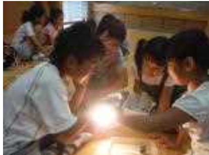
6/30 4年生京セラ環境出前授業