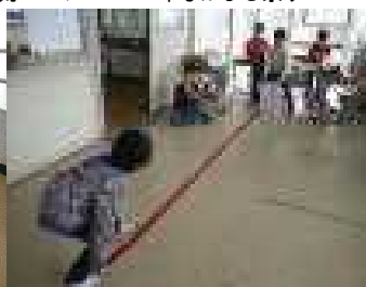
12/2 ボランティアさんお礼の会