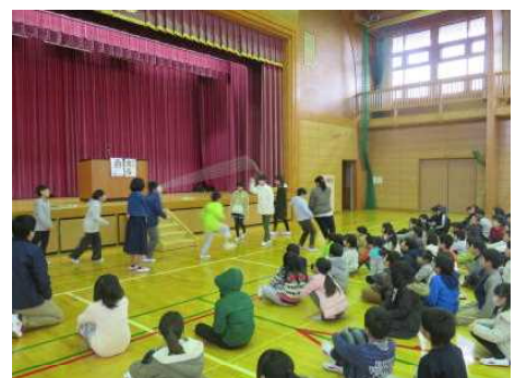
体育委員会・なわとびチャレンジの説明