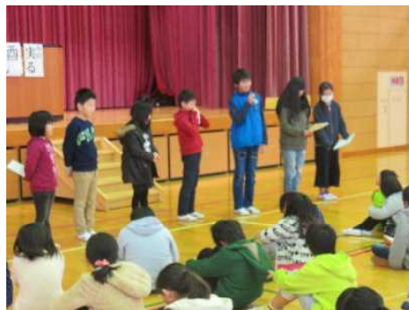
3学期始業式 新年の抱負発表

一人一人を大切に、個々のよさを大切に教育していくということは、同時に、他人の考えを尊重したり認めたりすることが重要になってきます。人と人とが関わりながら、ともに生きるための力や豊かな心、よりよい社会の実現のために山積する問題等を解決するための能力が求められているところです。いただきました学校評価の結果や考察などを進めながら、蒲生東小学校のよりよい教育の在り方について検討し、職員一同、子どもたちの健全育成に力を尽くしてまいります。本年も、皆様の温かいご支援ご協力をいただきますようお願い申し上げます。