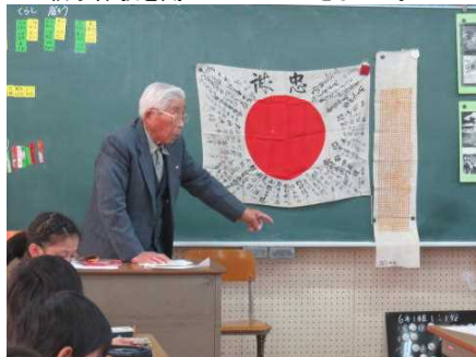
12/15 6年生平和学習 戦争体験を聞かせていただきました。