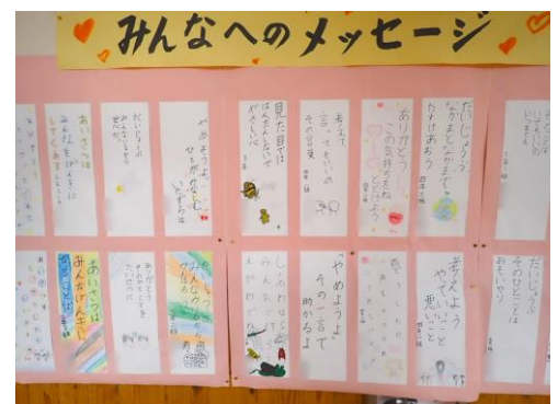
ぬくもりメッセージ

一年の終わりにあたりまして、保護者の皆様にはいつも多大なるご支援・ご協力を賜りましたこと心より感謝申し上げます。