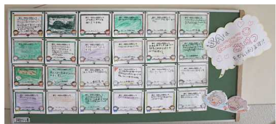
3年生「ニコニコあいさつ」