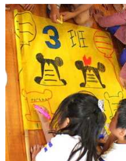
名前を書いて旗づくり

その後、班ごとに班の旗をつくります。デザインは、6年生がしてくれているので、名前を書いて仕上げていきます。各班、すてきな旗ができました。