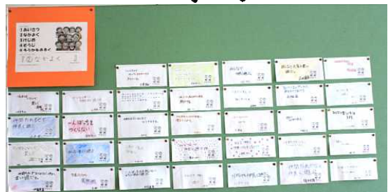
6年生「ワクワクみんななかよく」

元気にあいさつをする きちんとあいさつをするなどです。各学年の掲示板に貼って、みんなに知ってもらいます。1学期間取組み、その取組みについて終業式で、担任が話をします。そして、また2学期の取組みへとつなげていきたいと考えています。