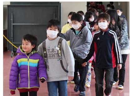
5年生と一緒に学校探検