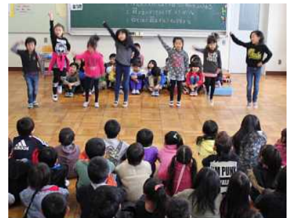
1年生：運動会ダンスの発表

3学期に入って、学校のいろいろなことが、6年生から5年生にバトンタッチされています。今まで6年生ががんばってくれた湖東第一小学校の伝統を、しっかりと5年生が引き継いでくれていることをうれしく感じています。終わった後、5年生の「やりきった!」という表情がとても印象的でした。幼稚園の子どもたちも、4月の入学を楽しみにしてくれていると思います。