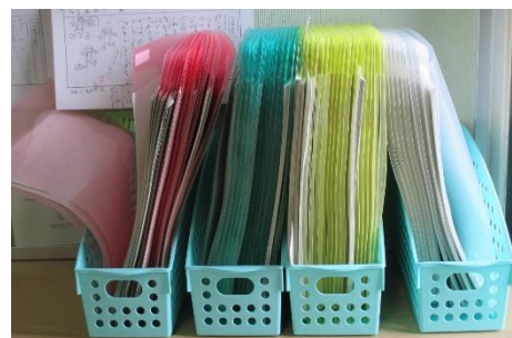
国語と算数、レベルでも色分けし、また、問題ごとにファイリングしてあります。上の学年ほどファイルの数が増えていきます。