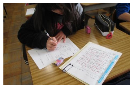
1、2年生は、みんな同じプリントから始めています。1年生はカタカナに挑戦中。