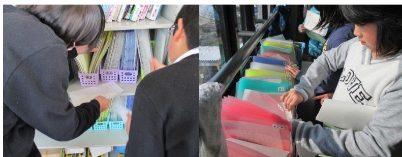
5、6年生は、多くのファイルの中から自分のレベルにあうものをさがします