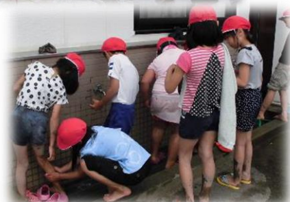
後始末は、友だちと助け合い。こんな姿も見られました。