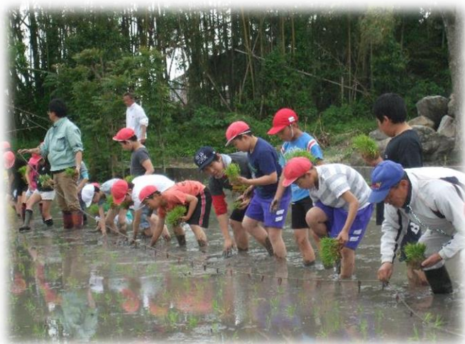
5年生は3回目の田植え、米作り体験は貴重です。