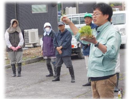
「日本晴」を2、3本ずつ植えます。

この田植えは、地域、僧坊生産組合の皆様、農業委員さん、JA等、関係の皆様のお力添えにより、実施をさせていただく事業です。田植えの仕方や稲について教わる中で、子どもたちが地域の皆様との関わって学ぶことを大切なねらいとしています。最終の5年生では、社会科や総合的な学習の時間の中で、学校のすぐ側のたんぼで稲の成長を観察したり、米づくりについて学習を深めたりしていく予定です。