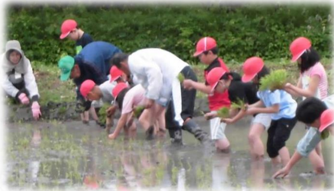
3年生、だんだん慣れて、コツがわかってきました。

年間を通じて地域の皆さまにはお世話になりますが、どうぞよろしくお願い申し上げます。