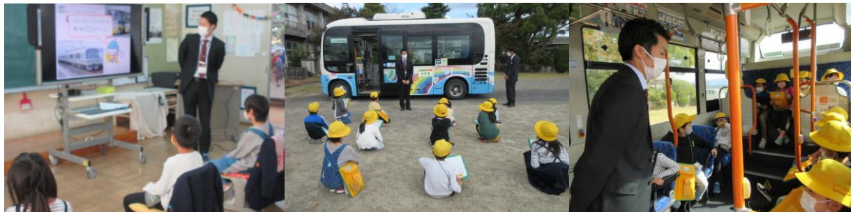
交通機関について学ぶ