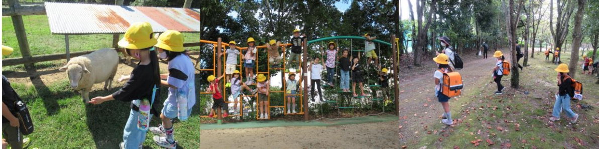
県畜産技術振興センター