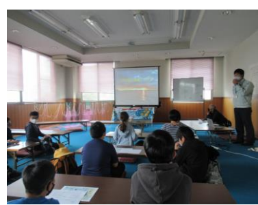
琵琶湖の漁業についての話

能登川漁業協同組合と滋賀県水産課の協力を得て、琵琶湖の漁業について考える学習を行いました。漁港に入ってくる漁船の水揚げの様子を見学させていただきました。その後漁船に乗って琵琶湖に出ました。琵琶湖側から見る陸の様子、身近に見る琵琶湖の水などを見学し、えりの内部を漁船を魚に見立てて最後の魚の入るところまでを再現してくださいました。長さ500m幅200mの仕掛けを目の前で見ることができました。