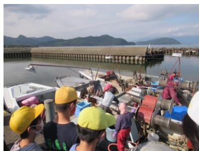
漁船からの水揚げ見学