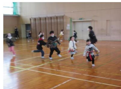
1・6年でしっぽとり