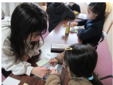
6年生へのメッセージ書き