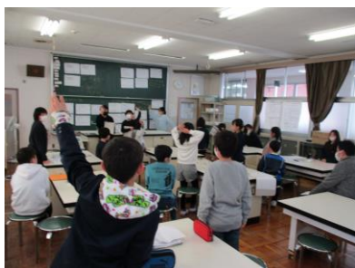
代表委員会での提案

これらの活動を通して、全校スローガン『みんなが協力 遊びも授業も 毎日が楽しい北小学校』へ近づこうとしています。ご家庭でも、子ども達の取組の様子や思いを聞いて、その値打ちについてお話しいただけると幸いです。