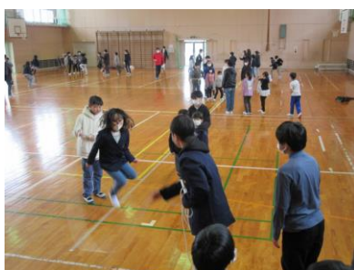
声を掛け合って跳びます