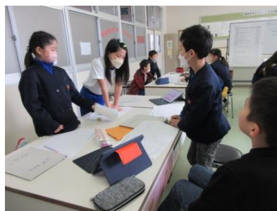
4、5年のリーダー会議