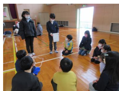
記録証を見ながら振り返り