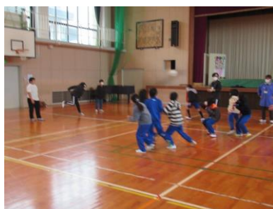
3・6年で王様ドッジボール