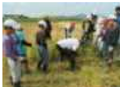
5年 稲刈り体験・・・9/5