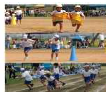
低・中・高学年団体競技