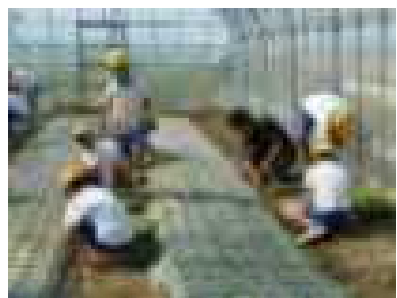
6年 チンゲンサイ植付・・・9/26