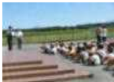
避難訓練(不審者対応)・・・9/1