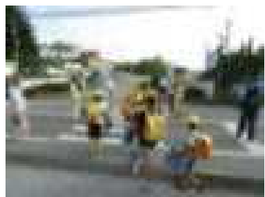
あいさつ運動(地域教育協議会)・・・8/28