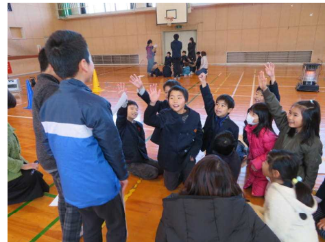
「これはだれのもちあじ？」当ててみよう！

子どもたちは、4月からどんどん成長しています。これも保護者や地域の方々のおかげと感謝しております。2学期もたくさんのご理解とご支援をいただき、ありがとうございました。