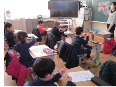
【1年】「正しいおはしの使い方」を栄養教諭から学びました。