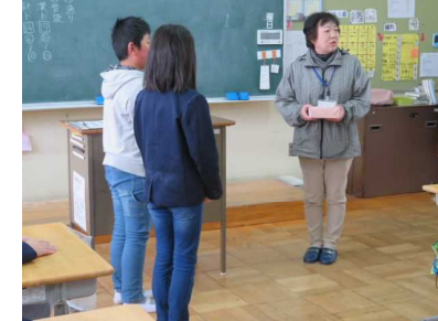
【6年】テニサービス「ひなた」様より卒業式用の陶花を贈呈いただきました。