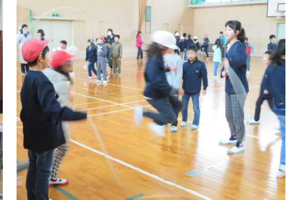
【全校】たてわり班対抗大縄跳び大会の班別練習が始まりました。