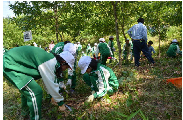
猪子山森林再生プロジェクト 6月14日