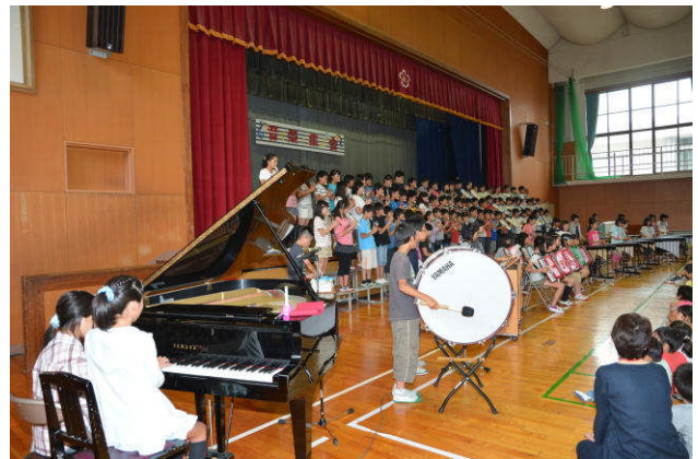
校内音楽集会 6月21日

能登川南小学校ホームページにも、子どもたちの活動の様子を掲載しています。是非ご覧ください。 ホームページアドレス： http://www2.higashiomi.ed.jp/notminamisho/