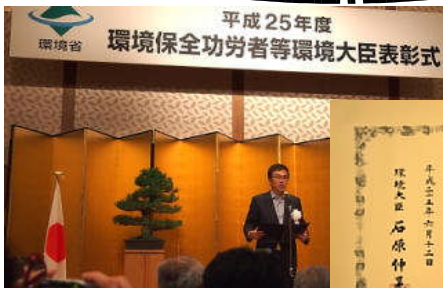
環境大臣表彰 6月12日