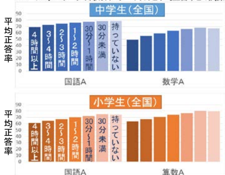
平成28年度全国学力・学習状況調査結果（国立教育政策研究所）より作成

その一方で、市内では中学生の全体の3割以上（34.7%）が1日に2時間以上の利用をしているという現状があります。