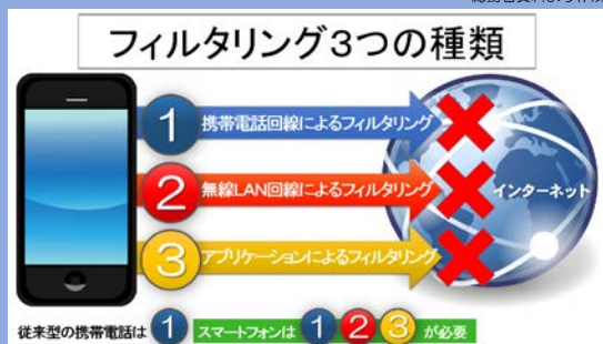
総務省資料より作成

詳しくは携帯電話販売店にご確認ください。また、下記URLでフィルタリングの方法について詳しい案内があります。Webで検索してください。