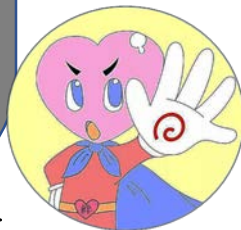
ストップ!のイメージキャラクター 「みんなの心をマモルマン」

子どもにスマートフォンやケータイを所持させることについては、十分にご検討くださるようお願いいたします。