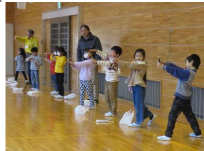
12月16日 1年竹とんぼ教室