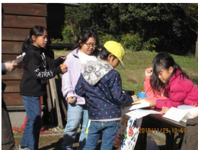
11月29日 3・4年やまのご学習